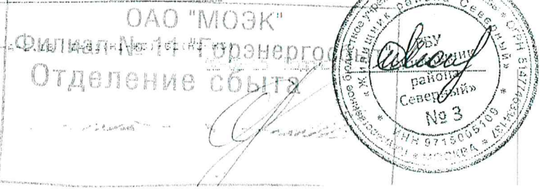
Табл. № 1-а М.П. № 1-а М.П. № 1-а